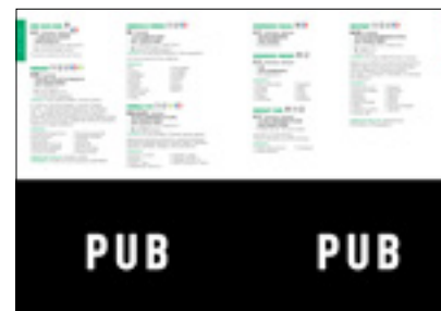
Demi-page d'annuaire / Demi-page de publicité