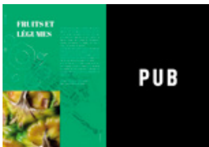
Présentation du secteur / page annuaire pleine page entrée de secteur