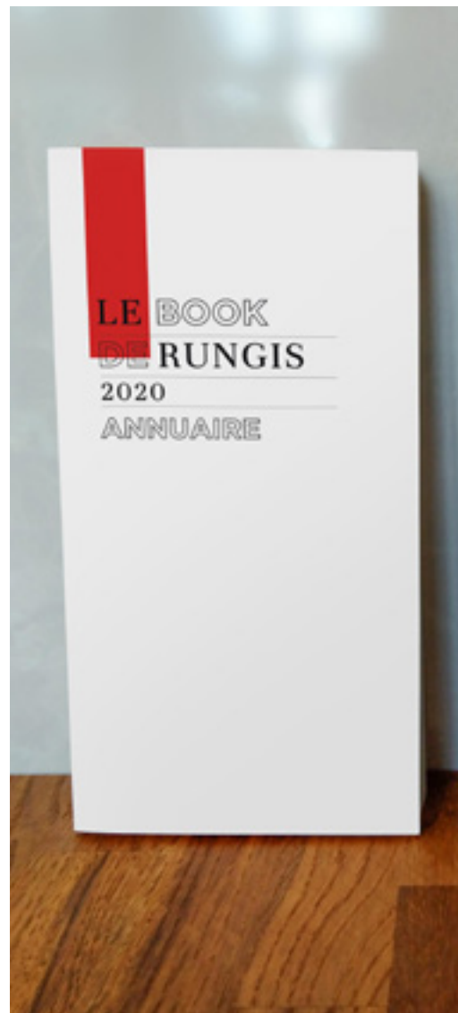
Book : l'annuaire Exemple de page

Un plan du Marché sera inséré dans l'annuaire, quelque soit le mode de distribution.