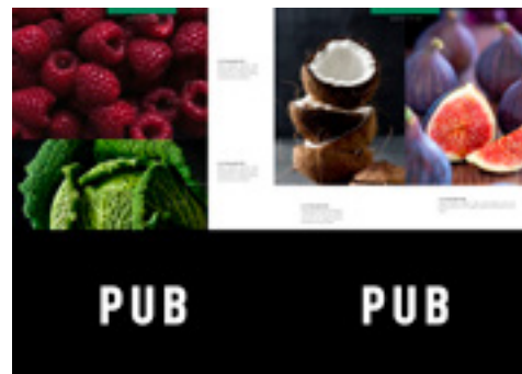
Demi-page de publicité