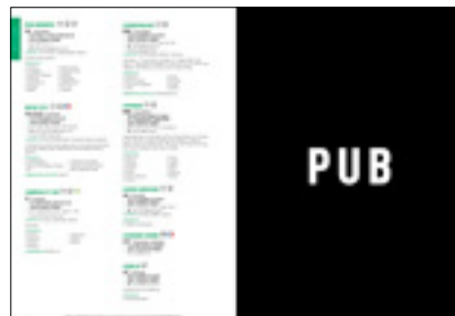
Page annuaire / Page de pub pleine page